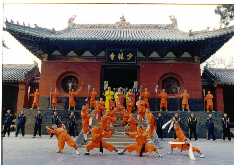
Le Temple de Shaolin

Renseignements : KUNG FU DEVELOPPEMENT – BP 122 – 38551 St Maurice L'Exil